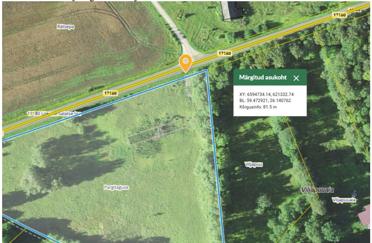
Joonis 1. Ristumiskoha asukoht tähistatud oranži tingmärgiga.